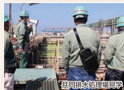
共同排水処理場見学