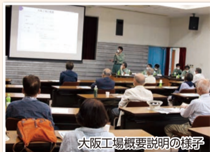
大阪工場概要説明の様子

当工場では高石市内の51自治会様を3区分し、毎年2回、地域の皆様との意見交換会を開催しています。2023年度は第1回目を6月6日(火)、第2回目を2024年3月15日(金)に開催し、工場概要や環境・安全の取り組み等のご説明と共同排水処理場を見学いただきました。また意見交換会では、自然災害に備えた取り組み等に関するご意見・ご質問をいただき、改めて保安・防災に対する重要性を再認識いたしました。地域の皆様からいただいたご意見を踏まえ、今後も安全・安心な工場を目指していきます。また、意見交換会を通じて当工場の運営に少しでもご理解を深めていただければ幸いです。