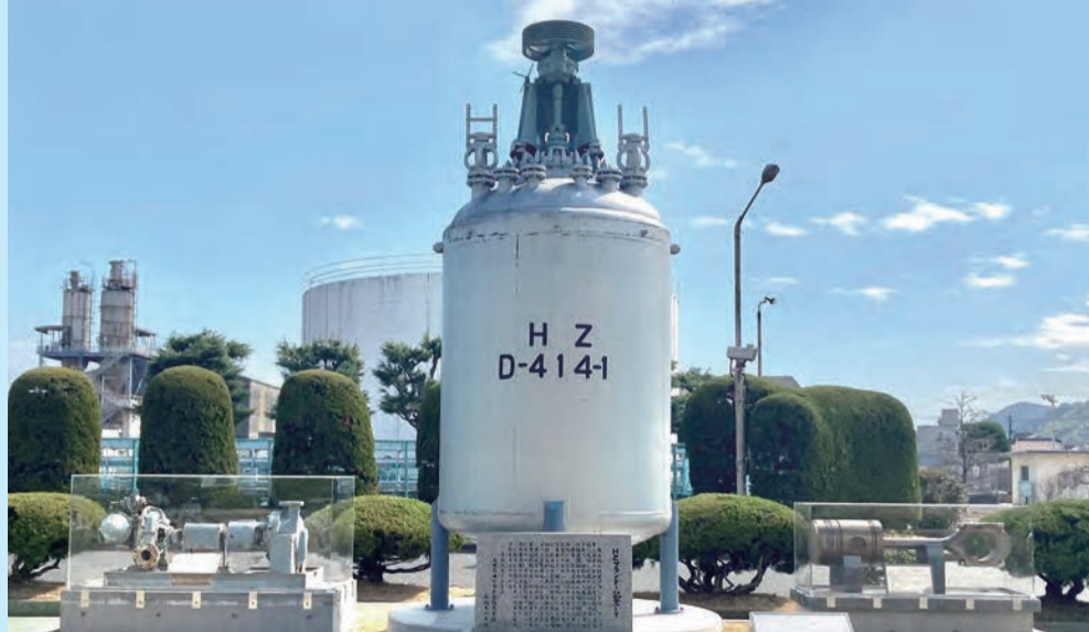
旧1E 原料ナフサ用ポンプ (1958年2月～1989年2月)