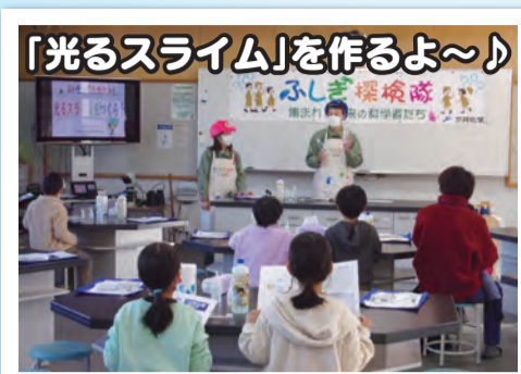
「光るスライム」を作るよ～♪

3年ぶりに、「和木小学校出前教室」(於:和木小学校)に出店しました。科学好き小学生計30名が参加してくれました。今回の実験アイテムは「光るスライム」です。