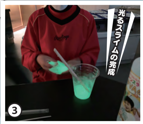
蓄光パウダーを混ぜたスライムを作って