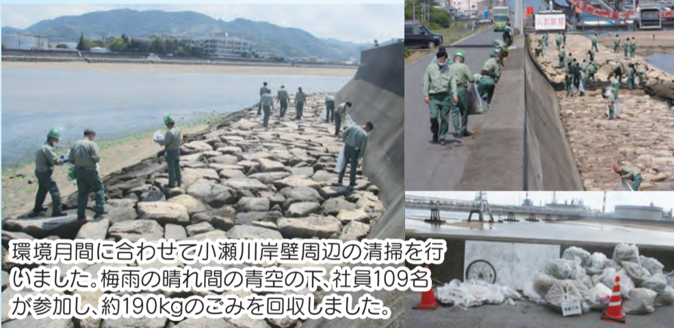
環境月間に合わせて小瀬川岸壁周辺の清掃を行いました。梅雨の晴れ間の青空の下、社員109名が参加し、約190kgのごみを回収しました。