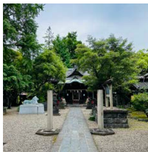
三囲神社 東京都墨田区向島にある神社。祭神は宇迦御魂之命（うかのみたまのみこと）周辺住民の方に愛されながら守られてきた。享保の時代から旧三井財閥の守り神としての神社でもある。

素材： 護符：SHIRANUI® MR™、御守袋：ポリエステル サイズ： 幅32mm*厚さ4mm