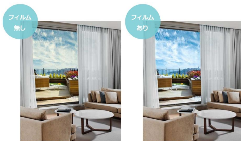
ポジカ®くつきり™フィルムによる視覚効果（イメージ写真）

https://www.tanseisha.co.jp/solution/closeup/posica