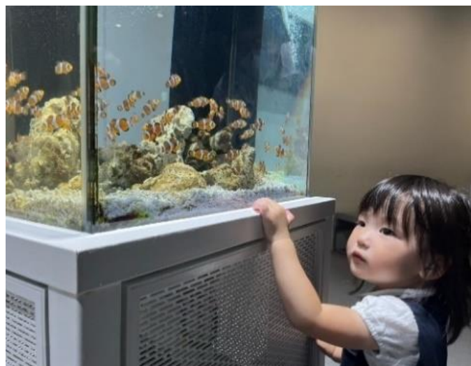
写真2 ポジカを貼った“わざにふれる水槽”の様子