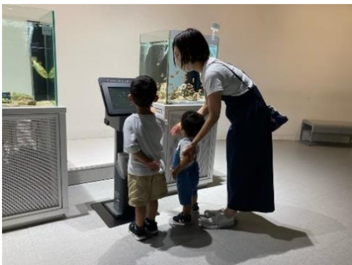
写真1 館内タッチパネルでアンケート収集