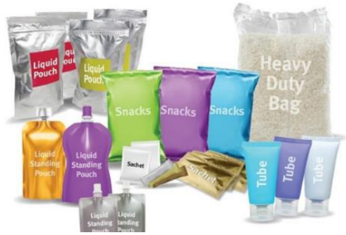
エボリュー®を使用した製品（イメージ）