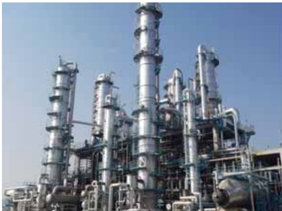
(写真：フェノール装置)

本プラントの稼働開始により、2009年1月より稼働開始しておりますビスフェノールAと併せ、原料から誘導品までの一貫競争力を持つ世界有数のフェノールチェーンが実現します。