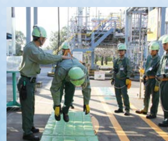
安全帯ぶら下がり体験