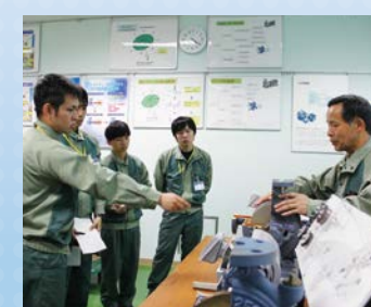
カットモデルを見て学ぶ