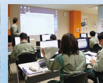
プラント制御をシミュレータと実機で学ぶ