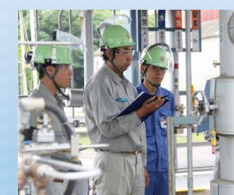
プラントの運転手順確認