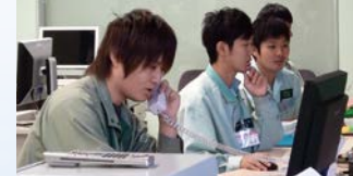
DCS(分散型制御システム) 研修設備