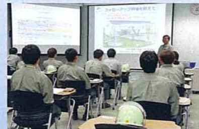
大研修室(収容人数 24名)