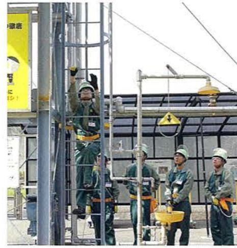
さる梯子昇降訓練