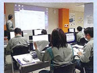
プラント制御をシミュレータと実機で学ぶ