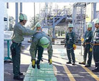
安全帯ぶら下がり体験