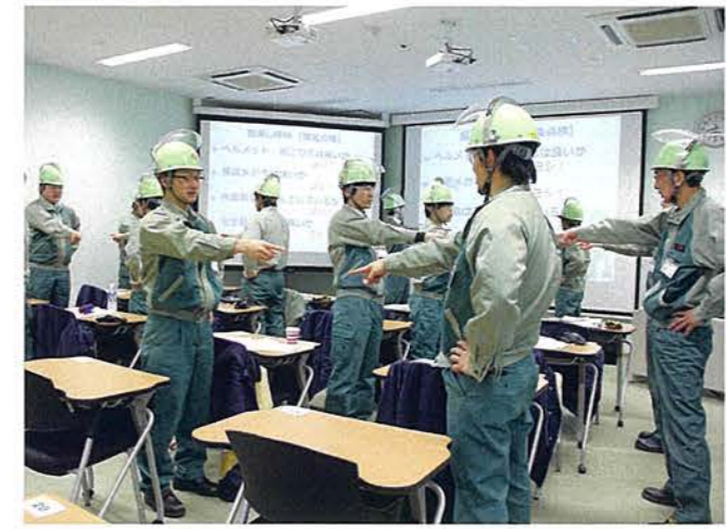
指差し呼称(服装点検)