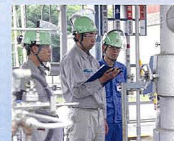
プラントの運転手順確認