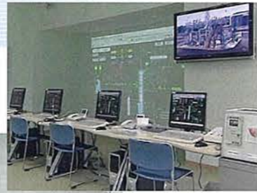
DCS(分散型制御システム)研修設備