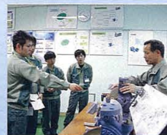
カットモデルを見て学ぶ