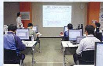
シミュレーターゾーン