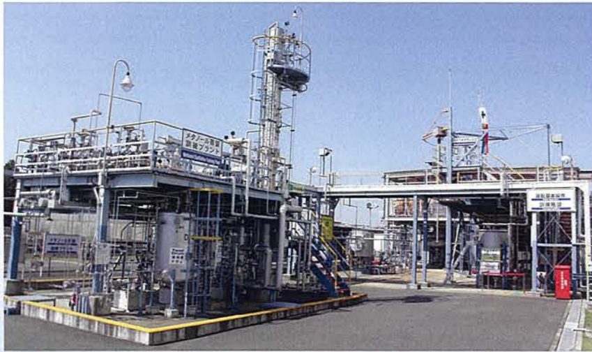
メタノール蒸留訓練プラントと水運転設備