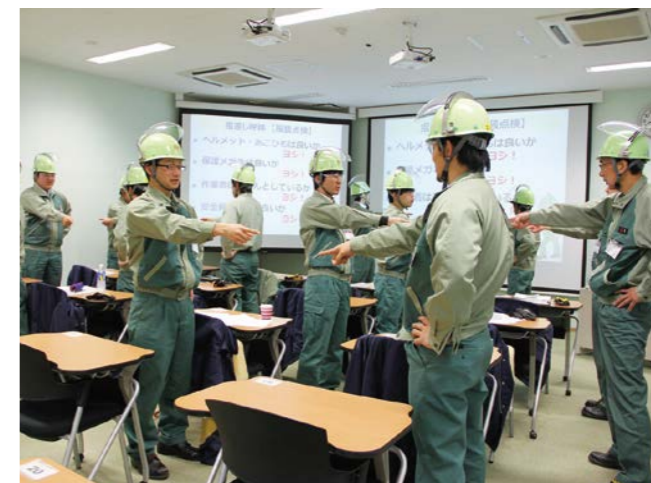
指差し呼称(服装点検)