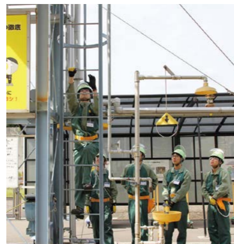
さる梯子昇降訓練