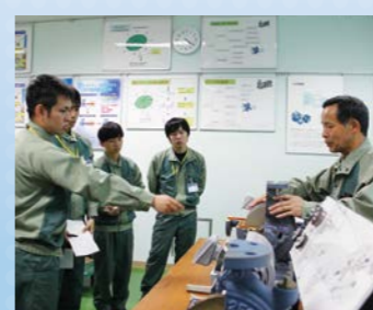
カットモデルを見て学ぶ