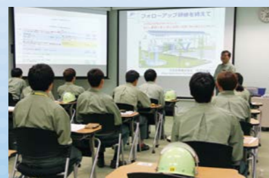
大研修室(収容人数 24名)