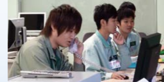
DCS(分散型制御システム) 研修設備