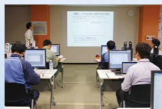
シミュレーターゾーン