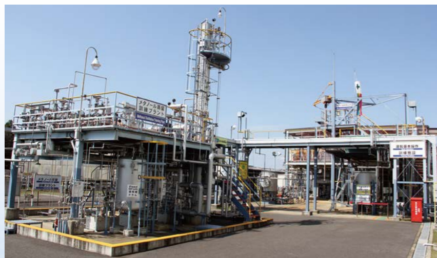
メタノール蒸留訓練プラントと水運転設備