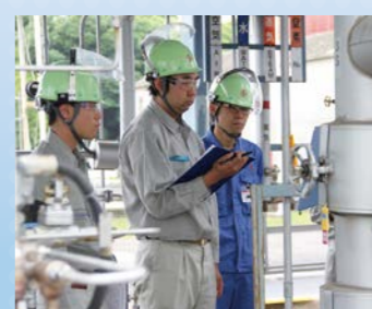
プラントの運転手順確認