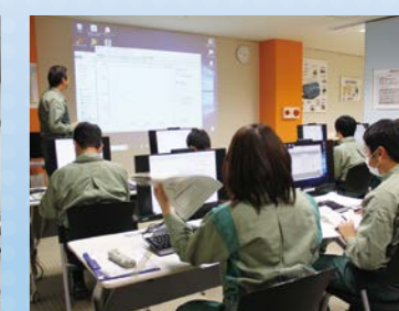
プラント制御をシミュレータと実機で学ぶ