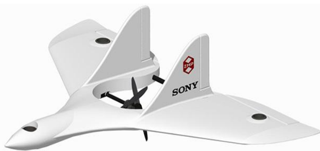
（サイズ：全幅 2169mm×全長 1579mm×高さ 594mm）

今回、三井化学はポリメタック®を活用した炭素繊維強化プラスチック（CFRP）とアルミジョイントの一体化部品を、UAV の骨格としてエアロセンス社に提供しています。アルミジョイントについては、全面的に形状設計も担当し、ねじなどの締結部品を使用しないシンプルな骨格を実現するとともに、骨格の剛性の向上や大幅な軽量化に成功しています。