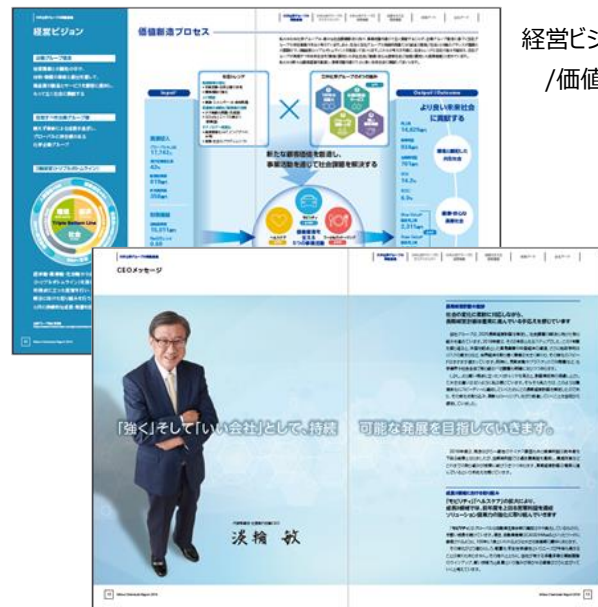
経営ビジョン /価値創造プロセス