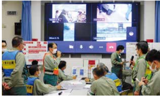
発災現場の状況をリアルタイムで把握

昨年10月25日、工場における重大災害を想定した総合防災訓練を実施しました。当日は、工場長を対策本部長とし、多くの関係部署が連携しながら、災害事例対応を行いました。大牟田消防署、大牟田市役所、大牟田警察署にもご協力頂き、本番さながらの訓練を行うことができました。訓練の実施により、非常事態に備えることも大切ですが、今後も安全をすべてに優先し、工場運営してまいります。