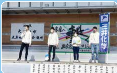
ステージにて会社紹介

昨年10月23日(日)にイオンモール大牟田にて開催された本プロジェクトに当社大牟田工場も参加しました。このプロジェクトは大牟田市民や学生に対し、大牟田の魅力を知っていただく為に大牟田青年会議所主催で開催されました。大牟田の企業が何を作り、それがどのように使用されているのかを知って体験してもらうことで郷土愛を育むことが目的です。当日は工場の紹介や製品の展示、くじ引きなどを企画し、三井化学大牟田工場をより多くの方に知っていただくことができたと思っております。これからも地域の皆様に当工場を知っていただけるよう努めて参ります。