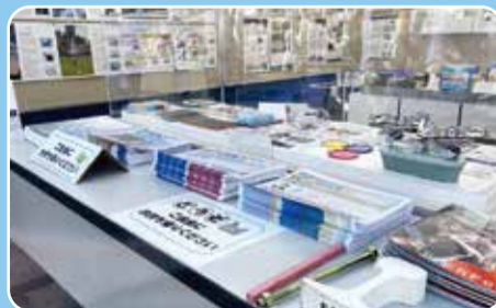
ブースでは歴史や三井化学について展示