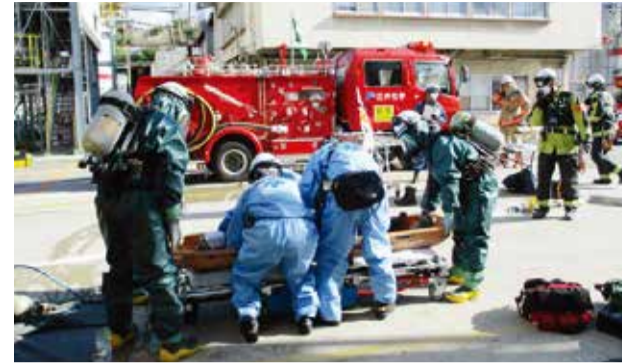
想定発災現場の様子