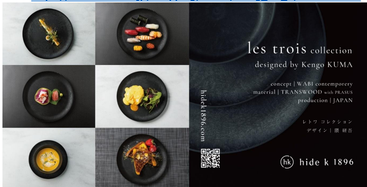
Prasus ® を使用した食器

URL : https://www.mistore.jp/shopping/brand/living_art_b/006606.html