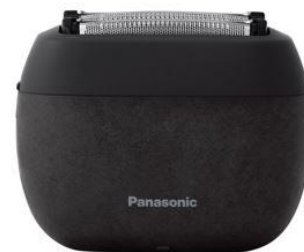
ES-PV6A は、「マーブルホワイト」と「マーブルブラック」2色のカラー展開