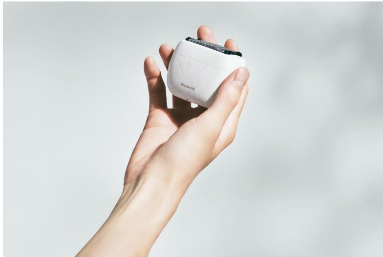
ラムダッシュの5枚刃テクノロジーを手のひらサイズに

「ラムダッシュ パームイン」は、手のひらサイズに5枚刃テクノロジーを凝縮し、指先で肌状態を感じながらなでるように剃る新体験のシェーバーで、9月1日(金)より発売されます。