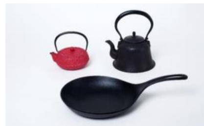
急須 格子アラレ (左)、平底撫肩鉄瓶 1L (右)、オムレット 24 cm (下)

400年以上の歴史をもつ南部鉄器。黒光りする渋い鉄瓶が有名だが、南部鉄器の工房の一つである岩鑄は、木炭、ガス、IH調理器と熱源を選ばない鉄瓶やカラフルな色の急須を開発し、現在は欧州、北米、アジアなど海外においても実績をあげている。以上のように、伝統的な技術、意匠を守りながらも、現在の生活様式に順応できるような技術革新を実現している点が評価された。