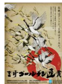
揮 毫：武田 双雲 イラスト：清水 裕子