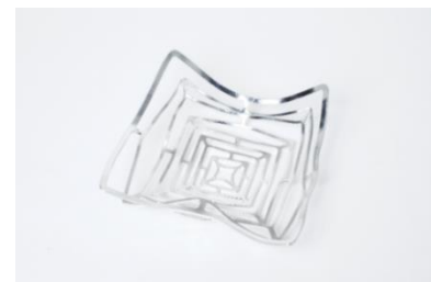
KAGO スクエア L

富山県高岡市に400年にわたり伝わる伝統的な鍛造技術を受け継ぎながら、様々な新しい試みを行っている。従来の流通に頼らない独自の展示会開催や、柔らかく扱いにくいとされてきた「錫(すず)」を用い、使う人が自在に「曲げて使う器」を開発し高岡銅器のイメージを変えた。さらにこうして得たノウハウを、産業全体の発展を視野に同業者に公開、職人の減少と高齢化が進む中、雇用を増やし若年層への技術の継承に成果を上げるなど、流通、商品開発、地域貢献など多岐にわたる活動が評価された。