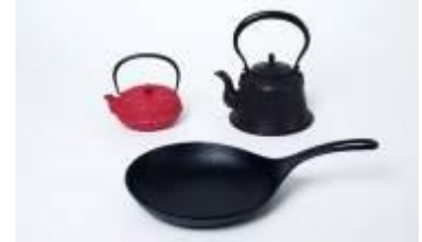
急須 格子アラレ (左)、平底撫肩鉄瓶1L (右)、オムレット24cm (下)

400年以上の歴史をもつ南部鉄器。黒光りする渋い鉄瓶が有名だが、南部鉄器の工房の一つである岩鋳は、木炭、ガス、IH調理器と熱源を選ばない鉄瓶やカラフルな色の急須を開発し、現在は欧州、北米、アジアなど海外においても実績をあげている。以上のように、伝統的な技術、意匠を守りながらも、現在の生活様式に順応できるような技術革新を実現している点が評価された。