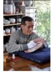
ふくしまぶざん 福島武山 九谷焼／石川県能美市