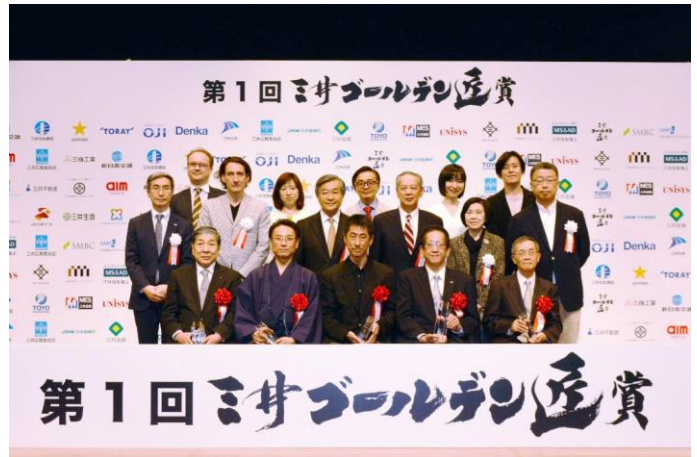
前列 受賞者5名／後列 審査員