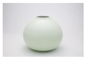
〈代表作品〉 黄磁釉 花瓶(菊)