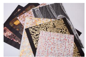
〈代表作品〉 ギルディング和紙