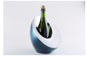
〈代表作品〉 鉋起和器 MOON