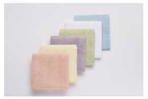
〈代表作品〉 花ふきん