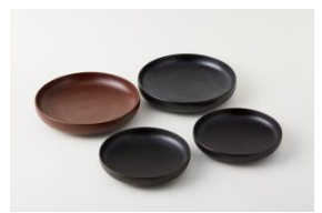
〈代表作品〉 蒔地小福皿、千すじ小福皿