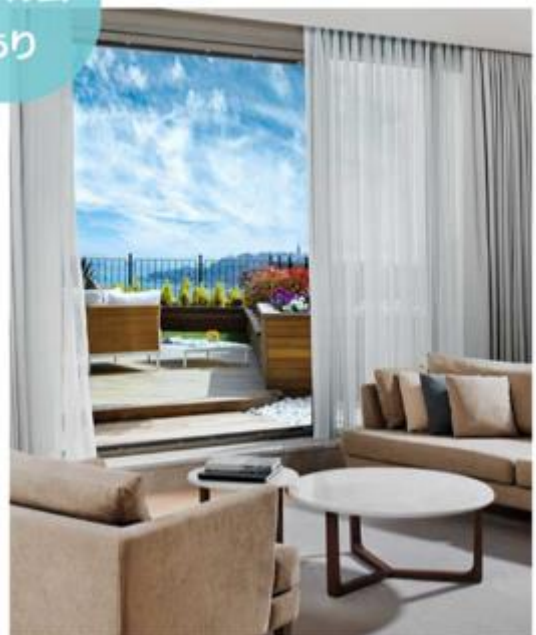
ポジカ™フィルムによる視覚効果（イメージ写真）