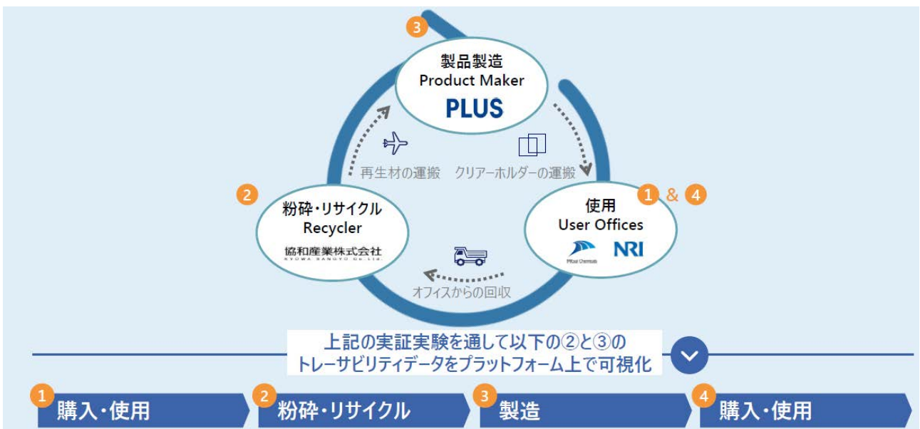
図2. トレーサビリティデータの連携の様子