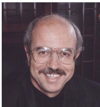
Kyriacos C. Nicolaou 教授