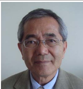
根岸 英一 教授